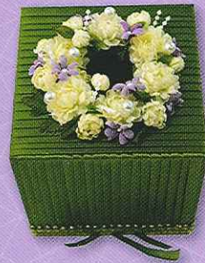
8 กล่องทิชชู...เชียวซจิทวิรัก ราคา 250.- บาท