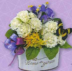
10 แจกกันมะลิบาน...หวานรัก ราคา 320.- บาท