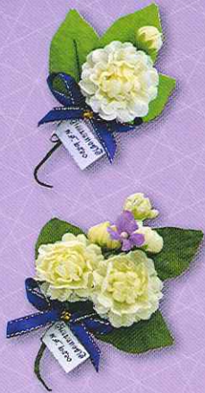
1 ช่อมะลิ "รักแม่" ราคา 10.- บาท