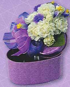
6 กล่องหัวใจใส่รัก ราคา 190.- บาท