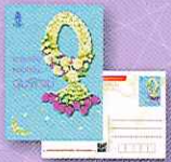
พวงมาลัยหอมกรุ่น...อุ่นรักแม่