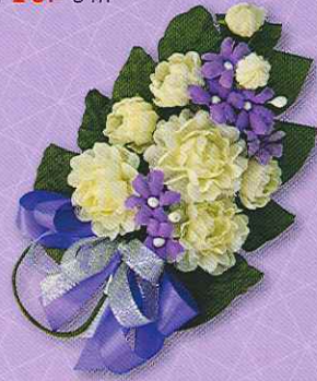
3 ช่อมะลิ "ร้อยรวมรัก" ราคา 50.- บาท