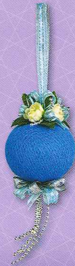
5 โม่บาย...สายใยรัก ราคา 150.- บาท