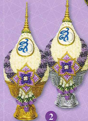
1 ช่อมะลิ...สายใยรัก 2 ช่อมะลิ...รวมใจรักแม่ พานพุ่มศุภณภูมิ พานพุ่มพิศมัยพิไลลักษณ์ ขนาดพาน 8 นิ้ว ราคาพานละ 2,000.- บาท ค่าจัดส่งพานละ 100.- บาท