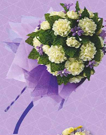
7 ช่อมะลิ...ปิดรัก ราคา 250.- บาท